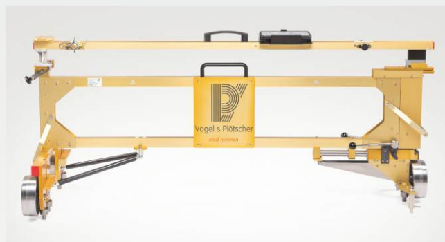
MessReg PTP II auf „WeichenCaddy“