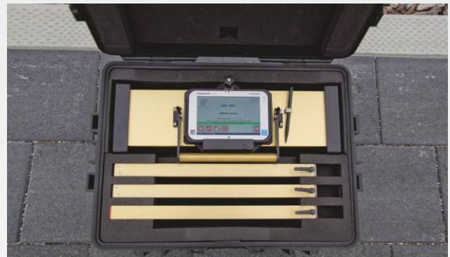
RM 150HR im Transportkoffer