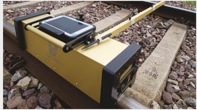
RM 150HR mit modularem Stützarm