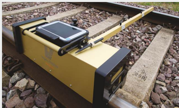
RM 150HR mit modularem Stützarm

Vogel & Plöttscher GmbH & Co. KG | Geldermannstr. 4 | D-79206 Breisach Tel: +49 (0)7667 946100 | E-Mail: info@voploe.de | www.vogelundploetscher.de