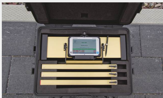
RM 150HR im Transportkoffer