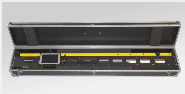
RM 1200 D im zugehörigen Transportkoffer