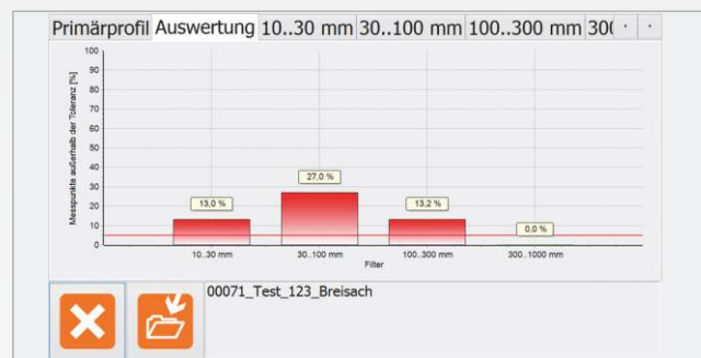
Messprogramm RMDcatcher mit integrierter Datenauswertung (optional)