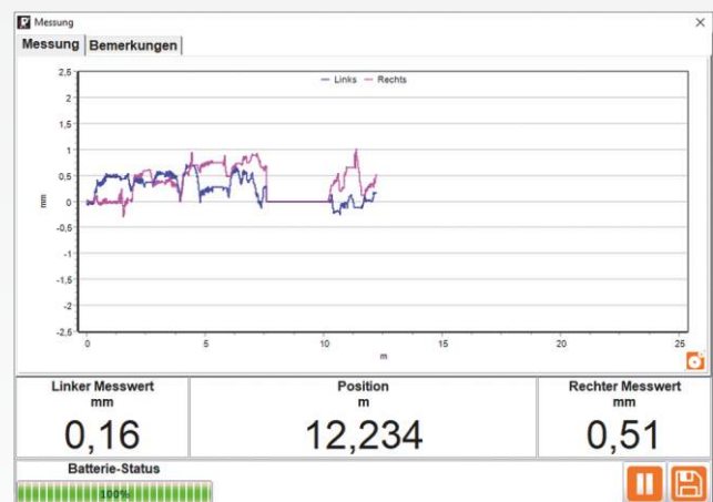
Datenerfassungssoftware RMFcatcher (pausiert)