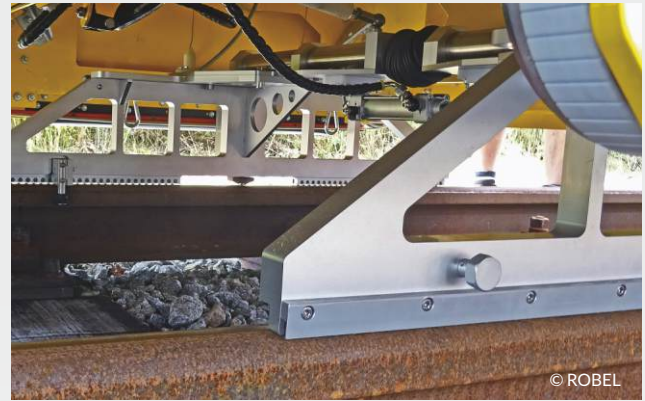
RMF 1100 integriert in Bearbeitungsmaschine

Vogel & Plötscher GmbH & Co. KG | Geldermannstr. 4 | D-79206 Breisach Tel: +49 (0)7667 946100 | E-Mail: info@voploe.de | Web: vogelundploetscher.de