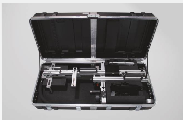
MessReg CTS dans sa valise de transport