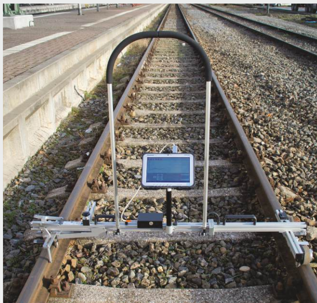
MessReg CTS avec tablette tout terrain "MPad"

* Toutes les indications se réfèrent à la largeur de voies nominale de 1435 mm. Autres largeurs de voies disponibles sur demande.