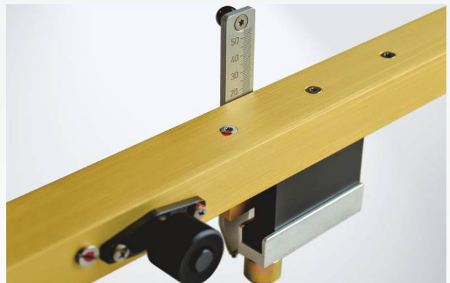
Support de mesure étroit avec unité de mesure de la profondeur des gorges (en option)