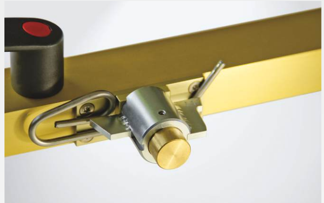
Support avec adaptateur de contrôle pour lames d'aiguilles (en option)