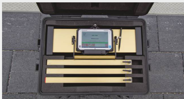
RM 150HR dans sa valise de transport