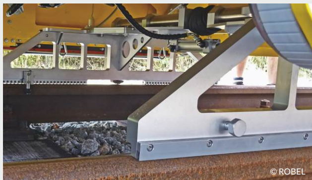
RMF 1100 intégré dans une machine à reprofiler

Vogel & Plötscher GmbH & Co. KG | Geldermannstr. 4 | D-79206 Breisach Tel: +49 (0)7667 946100 | E-Mail: info@voploe.de | Web: vogelundploetscher.de