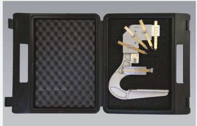
SKM 2 dans sa valise de transport