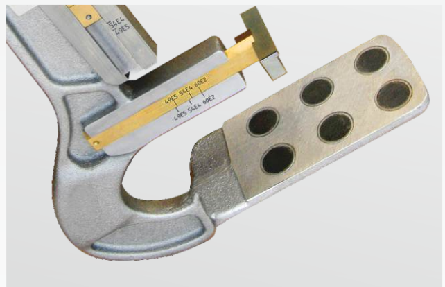
Plaque de butée au patin du rail avec aimants de maintien